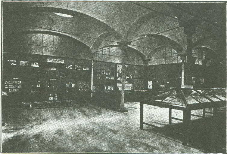
Exposició-Concurs de Dibuix i Treball manual. — Any 1919