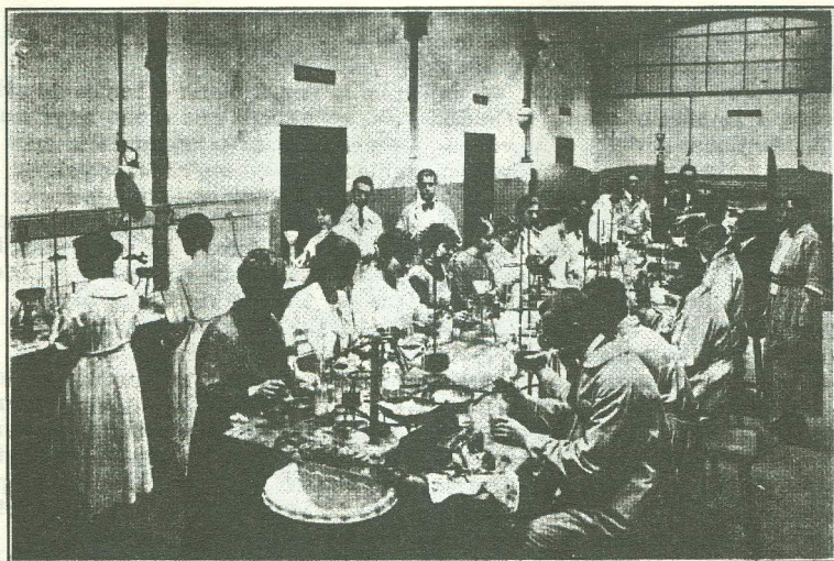
Classe de Química elemental. — Any 1919